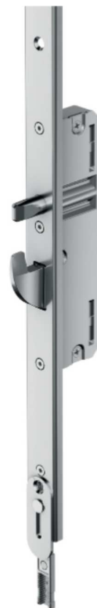
AKCESORIA DO ZASUWNIC WIELOPUNKTOWYCH KFV.