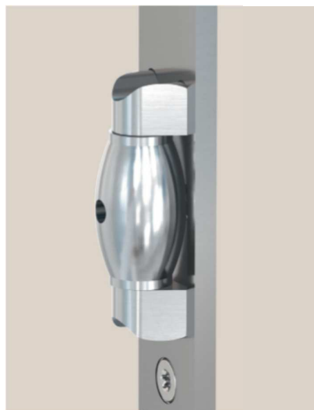
AKCESORIA DO ZASUWNIC WIELOPUNKTOWYCH KfV.